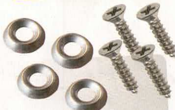
CUVETTE INOX X10 TABLEAU DE BORD

RÉF 132 P. PUBLIC. 1,95€ P. ADHÉR. 1,76€