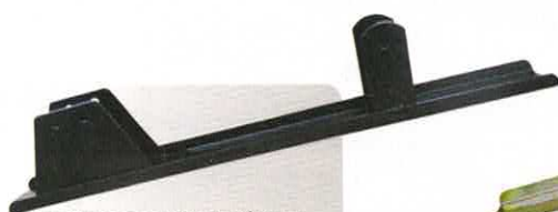
GLISSIÈRE DE SIÈGE MÉHARI STANDARD XI