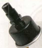
POMPE LAVE GLACE MANUELLE

RÉF 1622 P. PUBLIC. 3,66€ P. ADHÉR. 3,18€