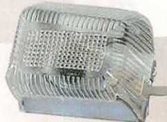
PLAFONNIER 2CV COMPLET

RÉF 250 (G) P. PUBLIC. 4,90€ RÉF 251 (D) P. ADHÉR. 4,26€