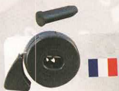
CLIPS MAINTIEN VITRE 2CV

RÉF 1451 P. PUBLIC. 19,49€ P. ADHÉR. 16,96€