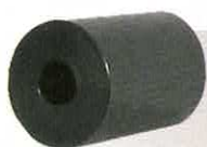
BUTOIR SUPÉRIEUR SIÈGE ARRIÈRE MÉHARI XI