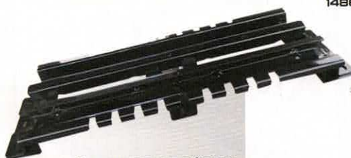
GLISSIÈRE CENTRALE SIÈGE XI