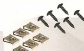
AGRAFES BOITIER TABLEAU DE BORD MEHARI

RÉF 619 P. PUBLIC. 14,50€ P. ADHÉR. 12,61€