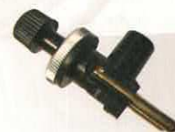
INTERRUPTEUR ESSUIE GLACE 1962-1974

RÉF 255 P. PUBLIC. 21,50€ P. ADHÉR. 18,21€