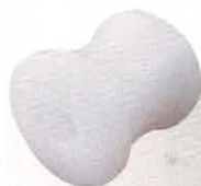
GLAET DE SIÈGE MÉHARI XI