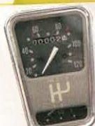
COMPTEUR MEHARI - 2CV

RÉF 294 P. PUBLIC. 9,50€ P. ADHÉR. 8,27€