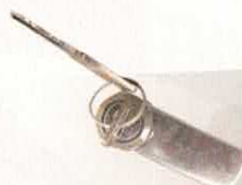
SERRURE BOITE À GANT MEHARI

RÉF 250 (D) P. PUBLIC. 4,90€ RÉF 251 (G) P. ADHÉR. 4,26€