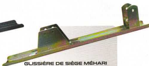
GLISSIÈRE DE SIÈGE MÉHARI GRAND MODÈLE XI