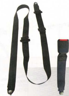
CEINTURE 3 POINTS SANS ENROULEUR XI