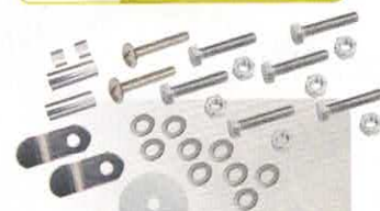
NECESSAIRE FIXATION GLISSIÈRE SIÈGE GAUCHE