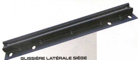
GLISSIÈRE LATÉRALE SIÈGE D OU G XI