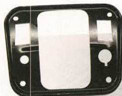
TOLE SUPPORT COMPTEUR AM

RÉF 2034 P. PUBLIC. 6,31€ P. ADHÉR. 5,49€