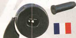
CLIPS MAINTIEN HAUT DE PORTE MEHARI

RÉF 742 P. PUBLIC. 5,05€ P. ADHÉR. 4,39€