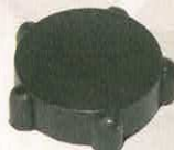
CAOUTCHOUC MOLETTE DE PHARE

RÉF 1858 P. PUBLIC. 34,13€ P. ADHÉR. 29,70€