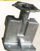
MOLETTE RÉGLAGE DE PHARE MEHARI

RÉF 1329 P. PUBLIC. 6,21€ P. ADHÉR. 5,40€