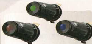
VOYANT ROUGE - VERT (V) BLEU (B)

RÉF 523 P. PUBLIC. 4,42€ P. ADHÉR. 3,85€