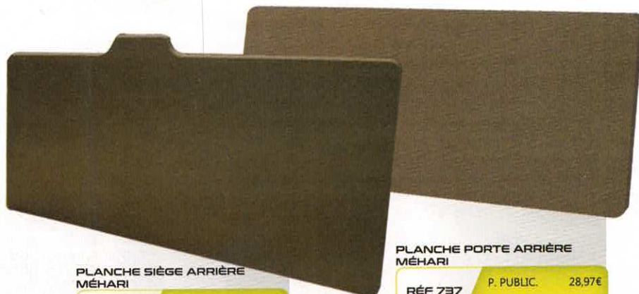
PLANCHE SIÈGE ARRIÈRE MÉHARI